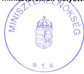
Dr. Semjén Zsolt miniszterelnök-helyettes